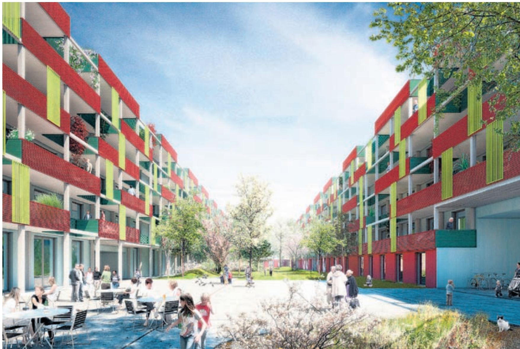
Pionierprojekt oder Untergang? Die Pläne der Baugenossenschaft Gesewo für ihr Generationenhaus an der Ida-Sträuli-Strasse in Neuhegi scheiden die Geister.